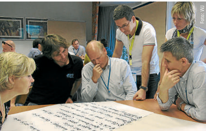
Zu Gast bei Kollegen in Stuttgart: Wirtschaftsjunioren aus Spanien, Belgien, Rumänien und den Niederlanden.

Junge Unternehmer aus ganz Europa trafen sich in Stuttgart zum „Multi-Twinning“